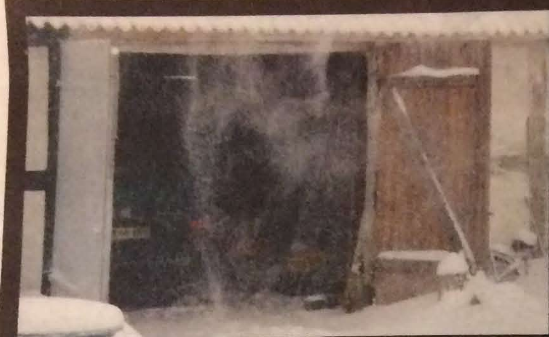
Rygende og fygende snestorm i Pederstrup ved Næstved.