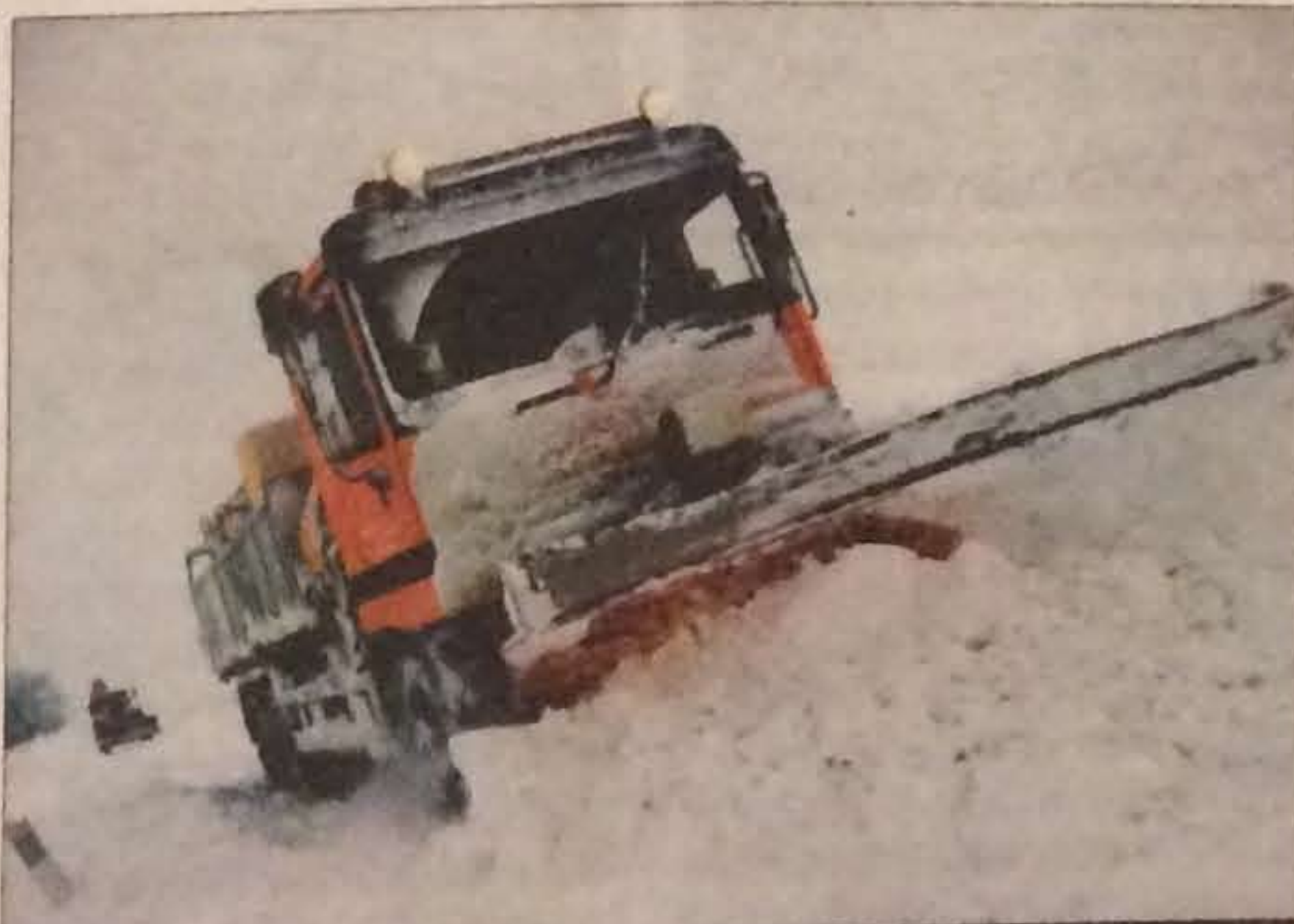
Her er dyret. Bjarnes elskede sneplov.

Men selv om snemasserne er lig med lange arbejdsdage for snerydderne, er det dage