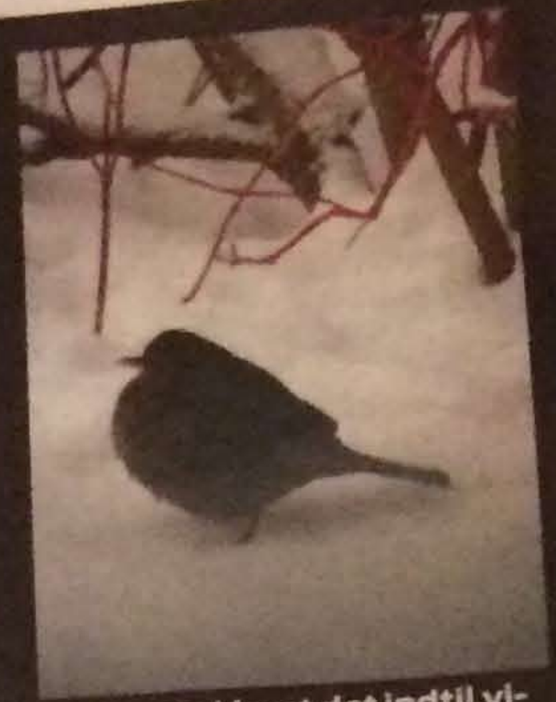
Jeg har da klaret det indtil videre her i Lyngby.