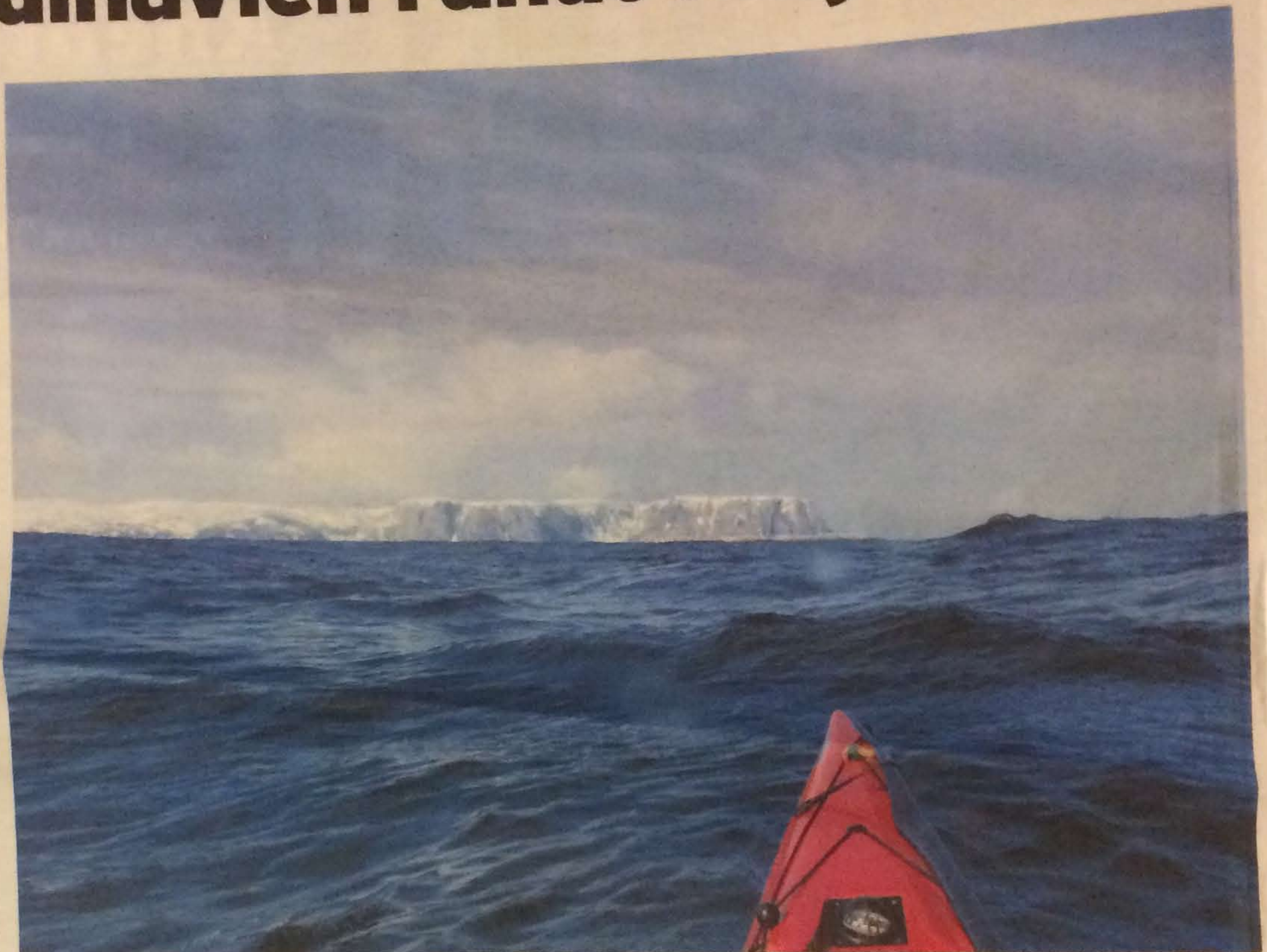
★ Erik B. Jørgensen er langt væk hjemme fra Nordvestfyn og naturoplevelserne er uovertrufne smukke.

- Det kræver dog, at jeg kommer lidt i læ.