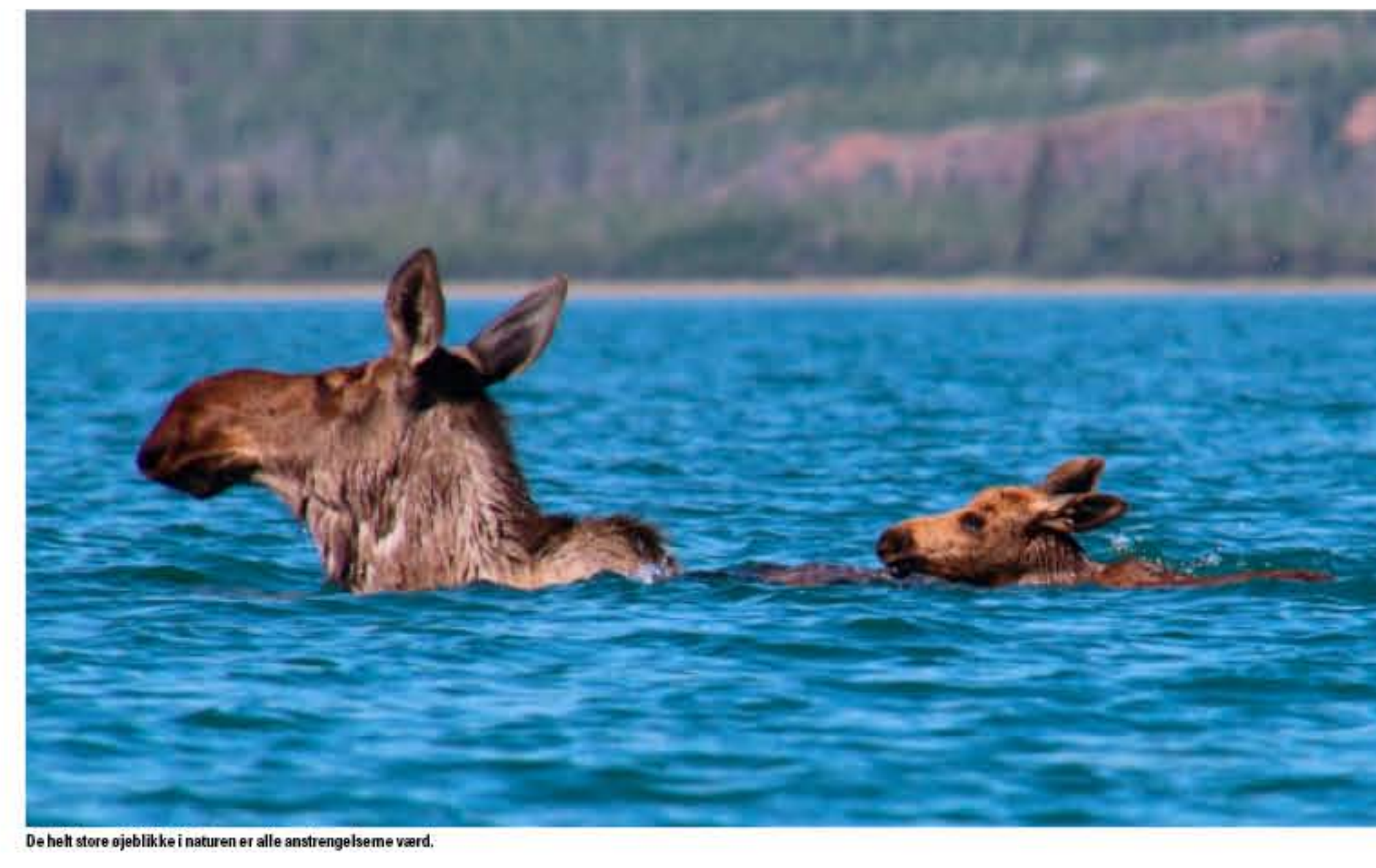
De helt store øbjørke i naturen er alle anstrengelse værd.