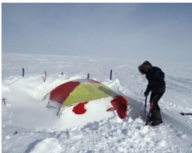
■ Det tog halvanden time at grave teltene fri efter den lange snestorm, som har holdt eventyrerne fanget.

når vejret jævnlige skifter over i "whiteout." Tåge kombineret med snevejr i et snehvidt landskab.