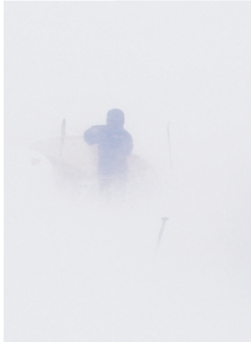
■ Foråret har budt på usædvanligt hårdt vejr på indlandsisen. Den danske ekspedition måtte strides med storme, tåge og tunge snefald.

at dale fra himlen. Overalt omkring dem ligger snedriver på 70 centimeter.