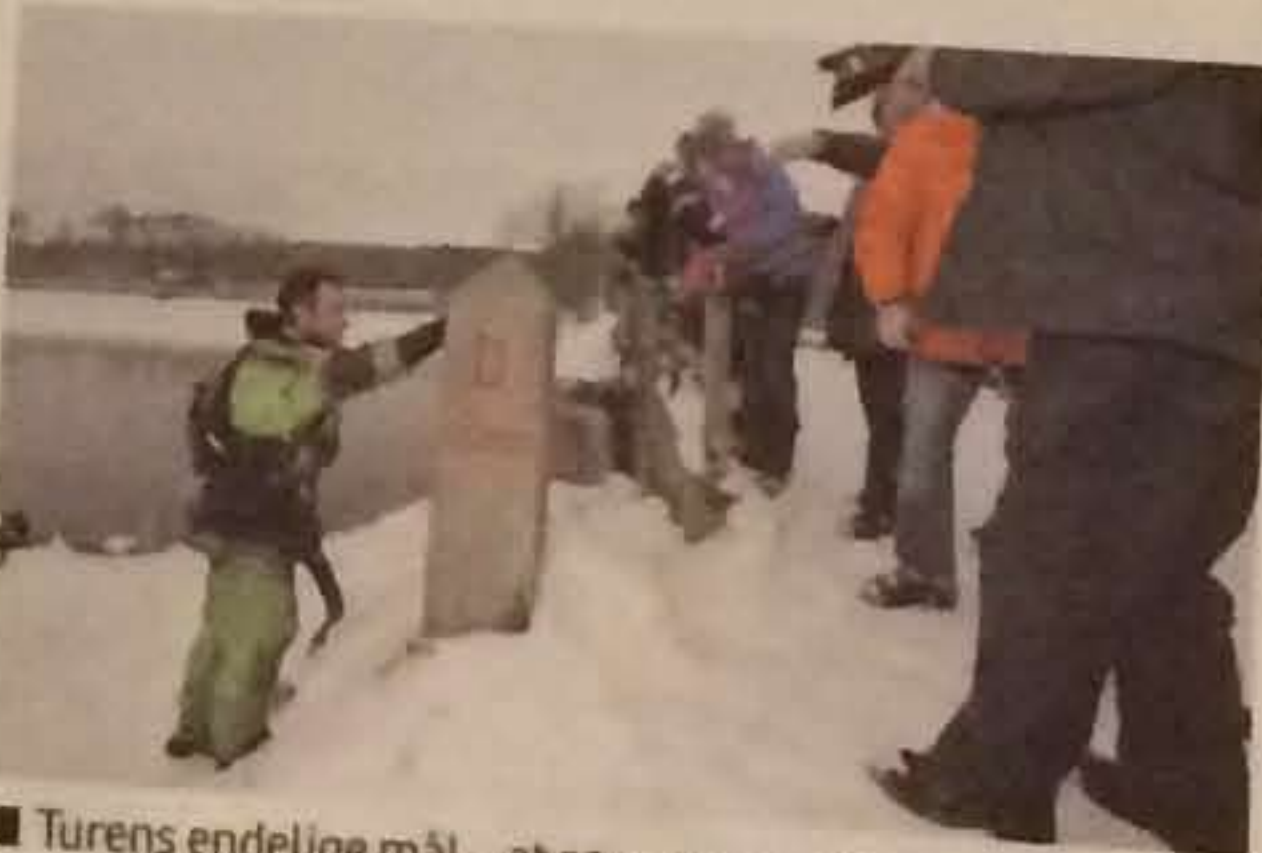
■ Turens endelige mål – at røre grænsestenene ved Flensborg Fjord. Her stod et hornørkester og tog imod den stædige kajakraer.

På den måde kunne jeg bevare fokus på vandet, siger han.