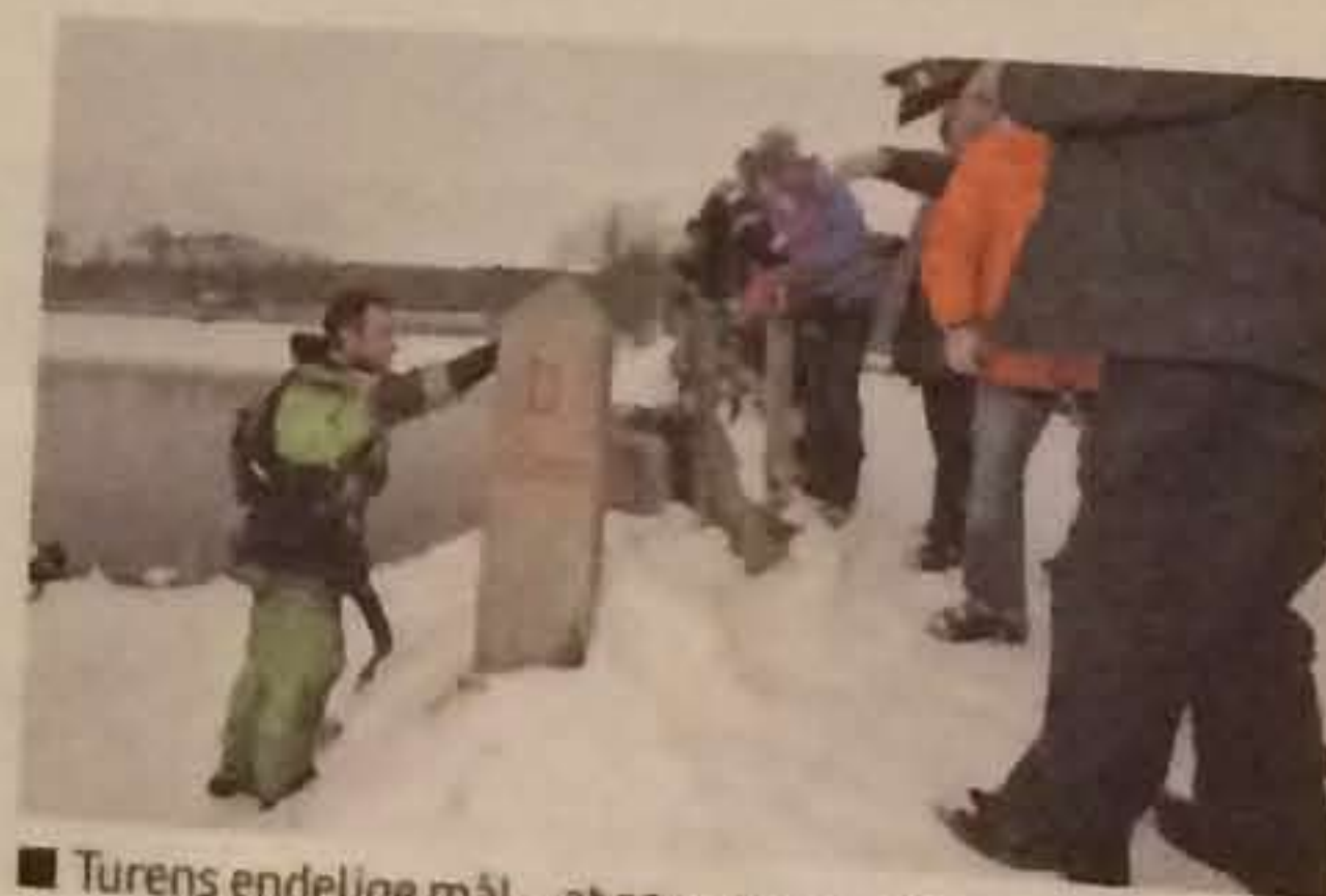
■ Turens endelige mål – at røre grænsesten ved Flensborg Fjord. Her stod et hornørkester og tog imod den stædige kajakraer.

”Frihed for mig er, at jeg kan gøre hvad jeg vil - ikke nødvendigvis i morgen eller på lørdag, men jeg kan se fremad og planlægge den næste tur.