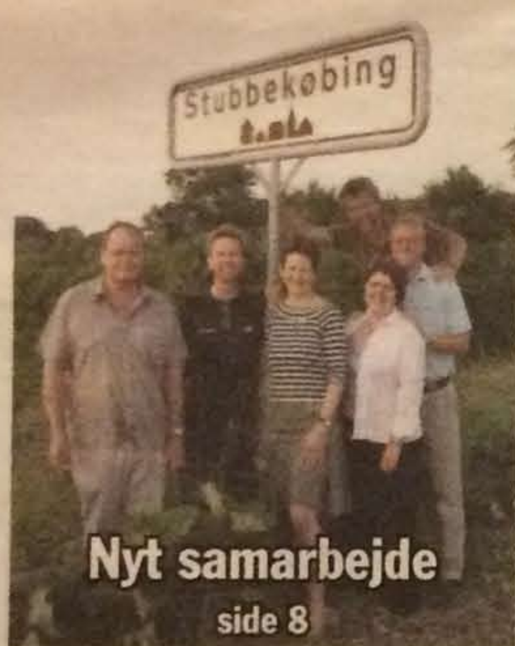
Nyt samarbejde side 8