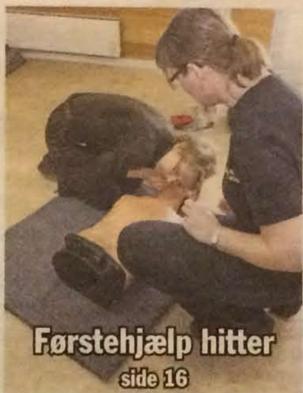
Førstehjælp hitter side 16