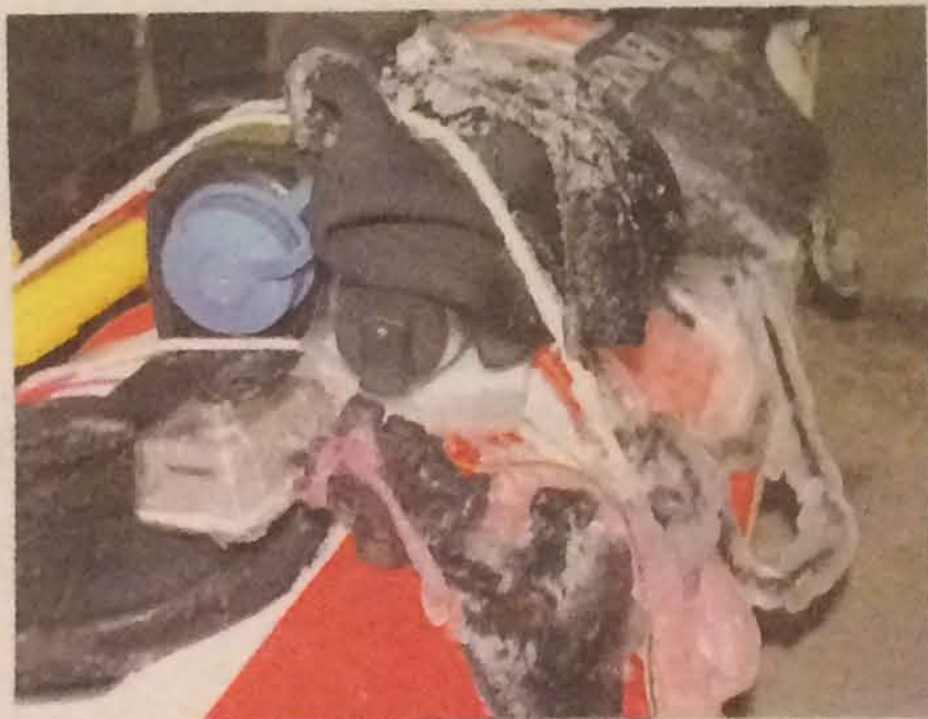
Isen havde sat sig tykt på havkajakken.

Det var ikke helt efter planen, at udfordringen skulle have det ekstra kolorit, som is- og snevinteren