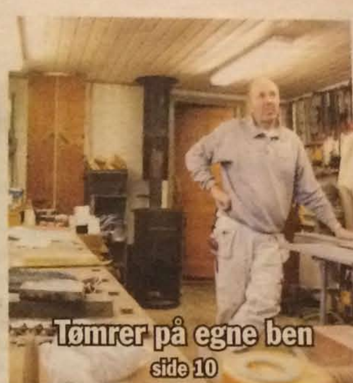
Tømmer på egne ben side 10