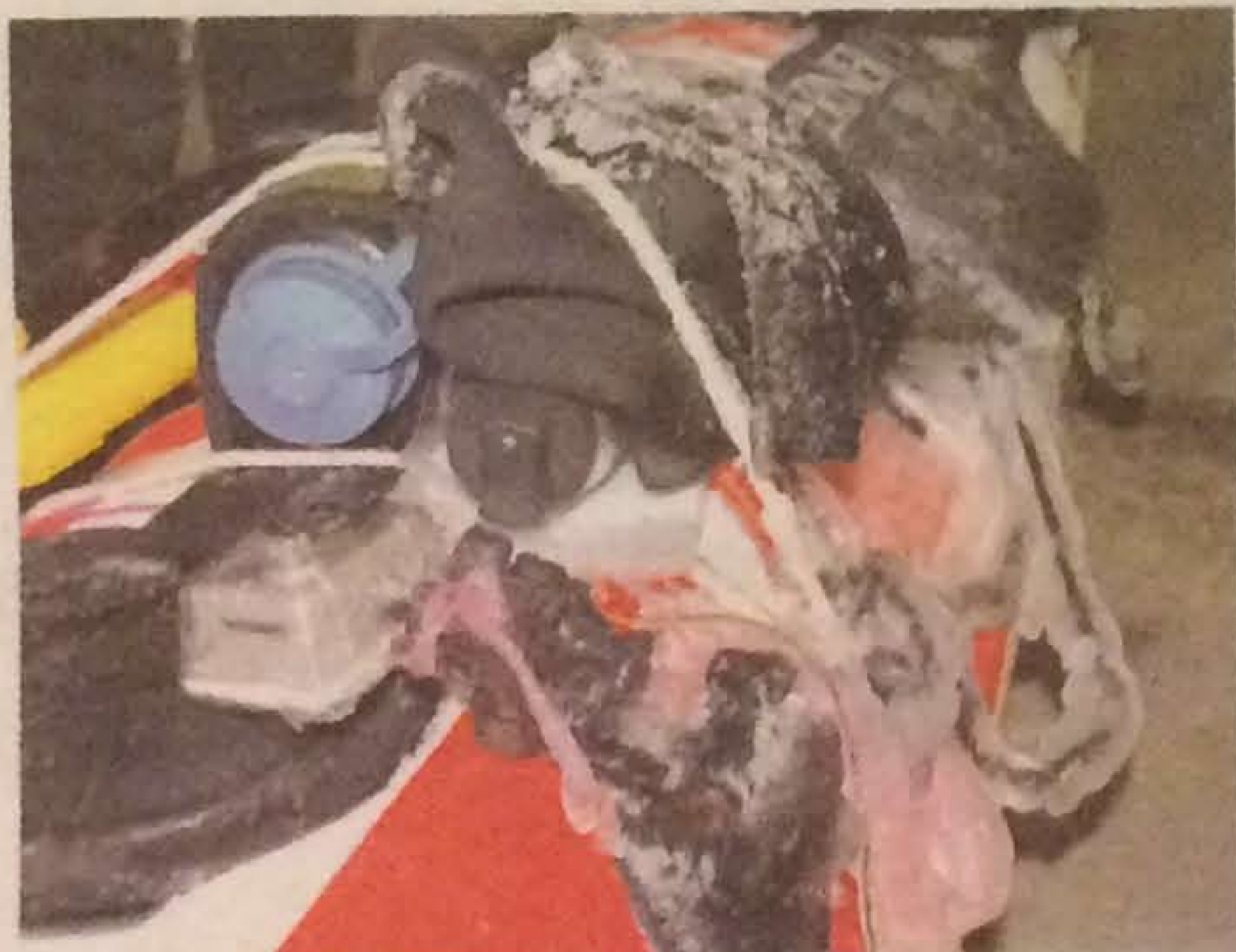
Isen havde sat sig tykt på havkajakken.

Det var ikke helt efter planen, at udfordringen skulle have det ekstra kolorit, som is- og snevinteren