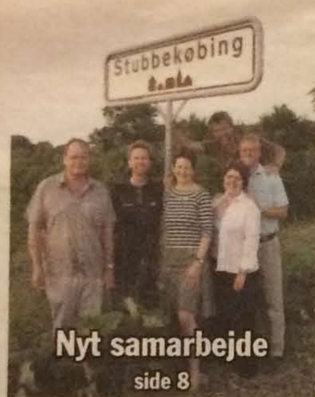
Nyt samarbejde side 8