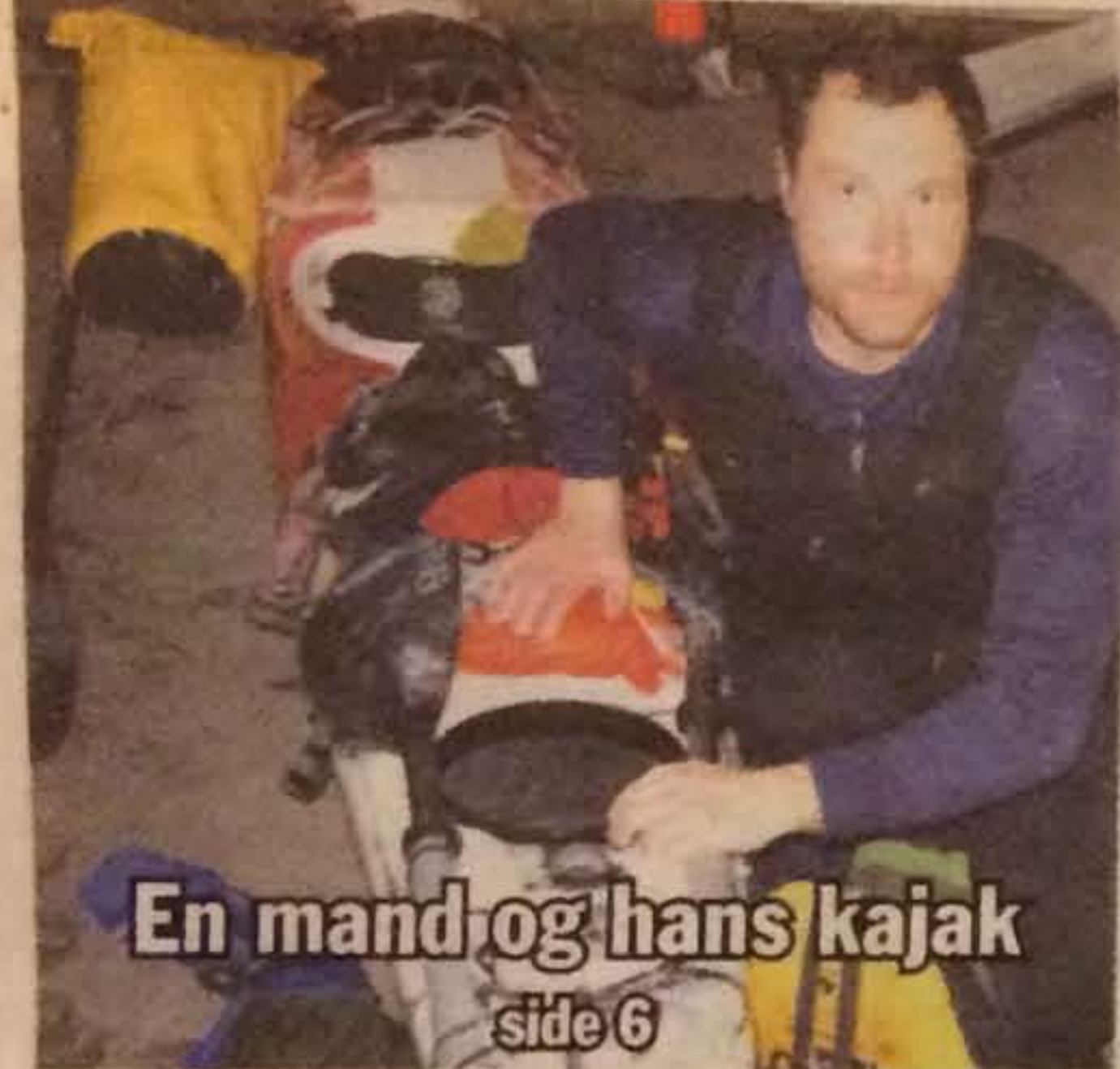
En mand og hans kajak side 6