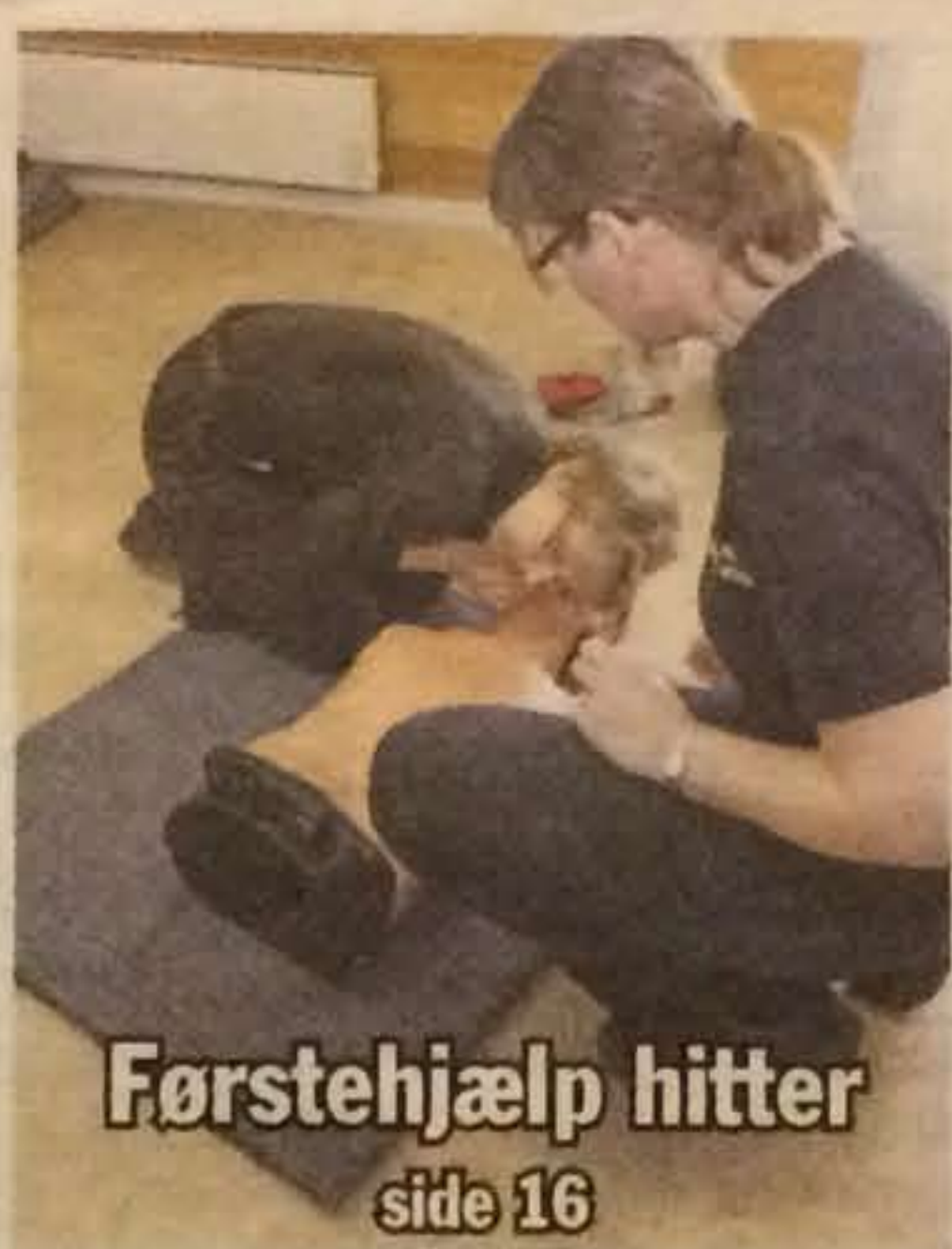
Førstehjælp hitter side 16