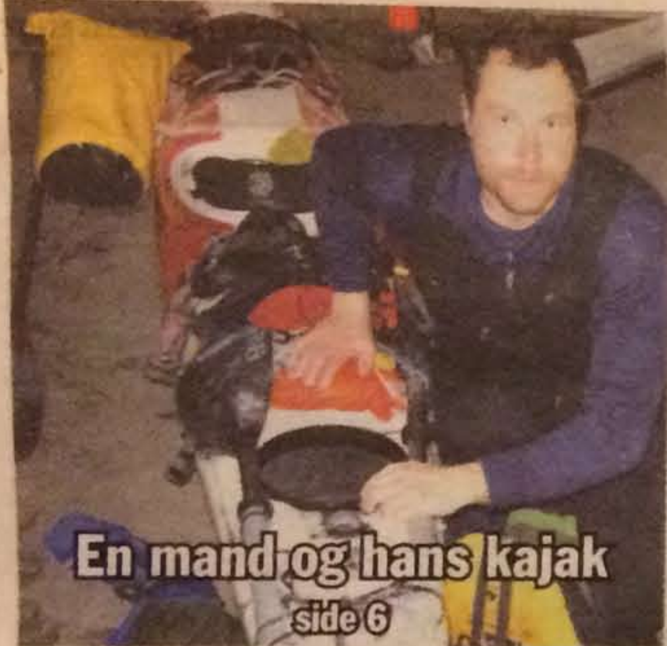
En mand og hans kajak side 6