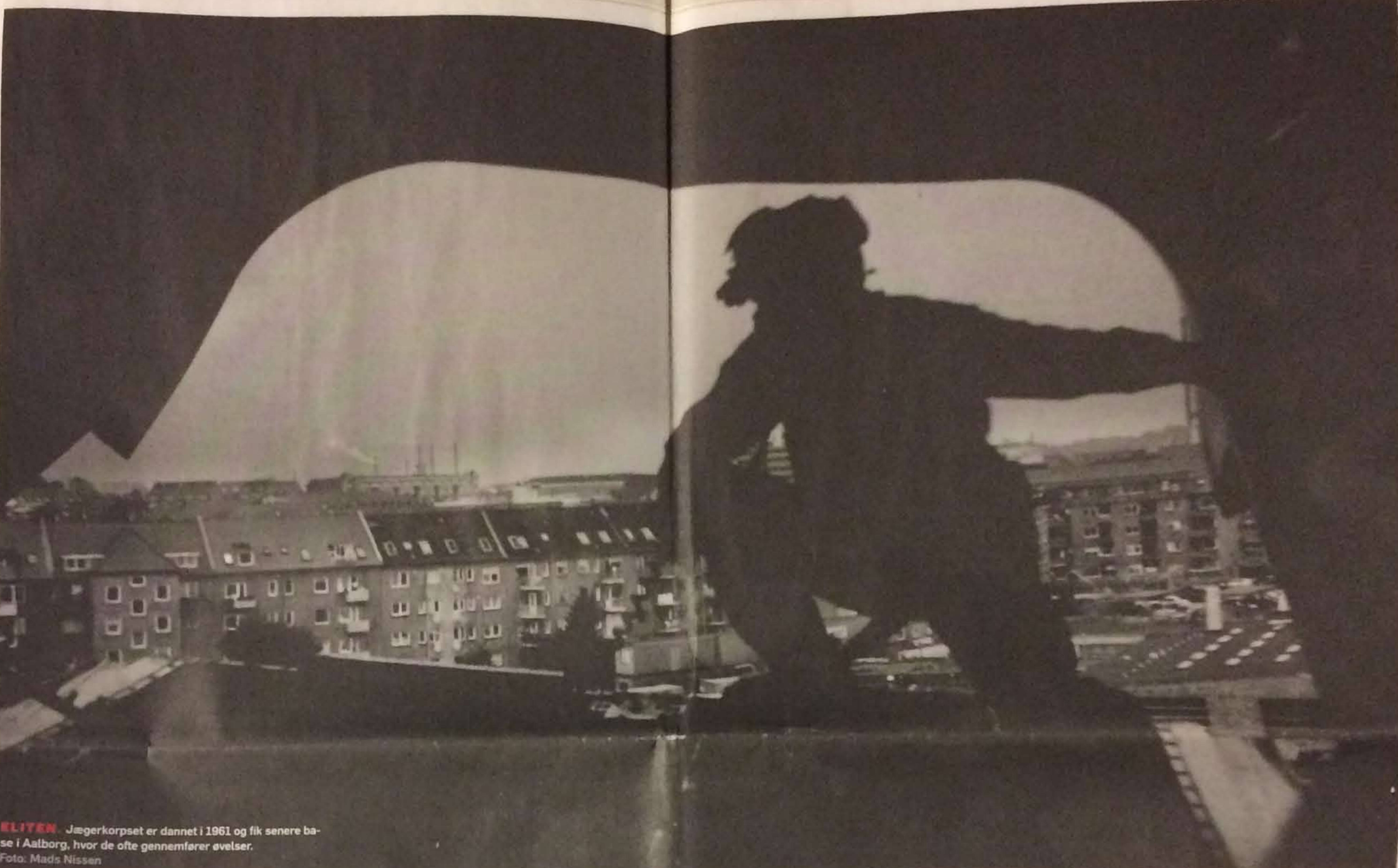
KLITEN Jægerkorpsen er dannet i 1961 og fik senere base i Aalborg, hvor de ofte gennemfører øvelser.