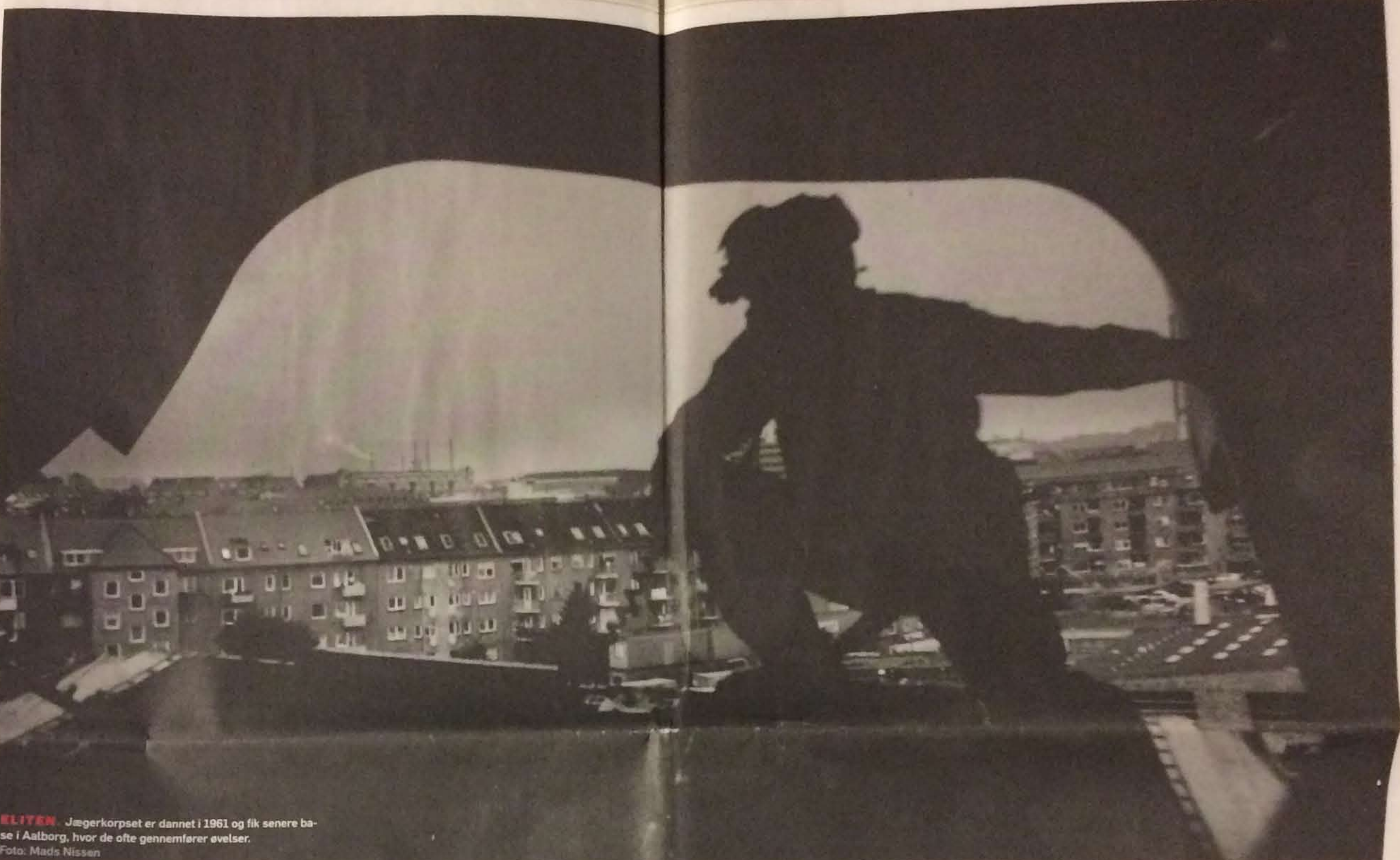
KLITEN Jægerkorpsen er dannet i 1961 og fik senere base i Aalborg, hvor de ofte gennemfører øvelser.