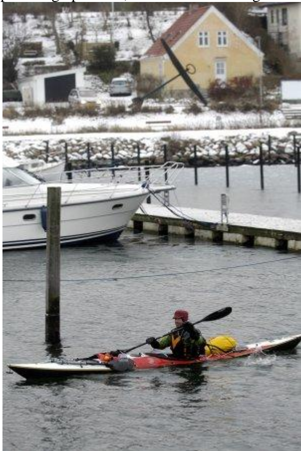
Se alle billederne