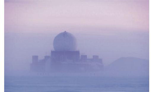
■ Første delmål på turen. Den forladte amerikanske radarstation DYE 2.

storm og nul sigtbarhed. Og midt i det hele kæmpede 10 danskere om at nå frem. Knap 600 kilometer på ski.